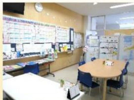
キャリア教育相談センター