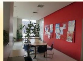
職員室前の相談スペース