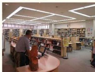
豊富な蔵書の図書館