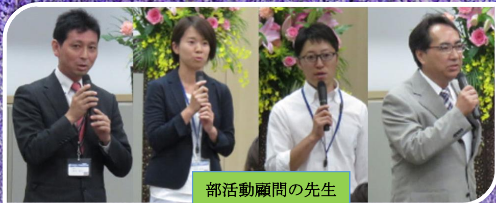
部活動顧問の先生

令和元年5月25日(土)視聴覚室において、「令和元年度PTA総会」が開催されました。