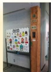
生徒の作った担架収納